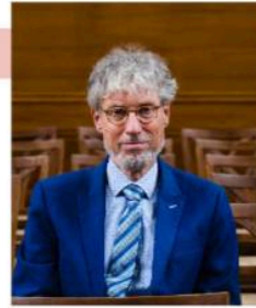
Tableau du milieu pastoral