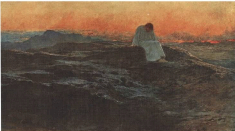
The Temptation in the Wilderness Briton Rivière, 1898, Guildhal Art Gallery London

Je n'ai compris ce qui se passait réellement dans ces trois tentations que lorsque j'ai lu un commentaire à leur sujet dans un livre de Martin Buber. Son livre le plus célèbre s'intitule Ich und Du . Il y dit que la vie d'une personne repose sur deux couples de mots. La paire de mots Ich- Du. Et la paire de mots Ich-Es. Son Ich est radicalement différent dans la paire de mots Ich-Du que dans la paire de mots Ich-Es. Dans le couple de mots Ich-Du, le Je est ouvert et réceptif. Cela peut surprendre. Le Je veut rencontrer l'autre. Tout peut arriver. Dieu même peut arriver, dit Buber. Parfois pendant juste un moment.