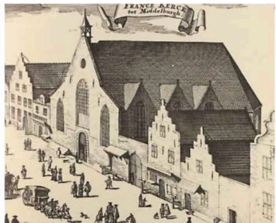
Eglise wallonne à la Sint Pieterstraat

C'est en juin 1930 que des visiteurs ont eu le droit à une visite guidée de cet édifice monumental : « accompagnés par le bedeau de l'église, nous sommes entrés par des couloirs sinueux dans la grande salle du consistoire (...). Dans cette salle est accrochée une peinture à l'huile d'un ministre de la communauté du XVII e siècle. Il y a aussi quelques photos de l'intérieur de l'église d'autrefois. Dans des boîtes entreposées dans une armoire se trouve un service de sainte-cène en argent offert par un membre de la communauté au XVIII e siècle, composé de deux channes, des plateaux pour le pain et des coupes, le tout en argent. Il y a une quinzaine d'années, l'entreprise Begeer de Voorschoten a fabriqué des petites coupes en se basant sur celles d'origine. Aujourd'hui, tous les participants à la sainte-cène boivent dans ces dernières.