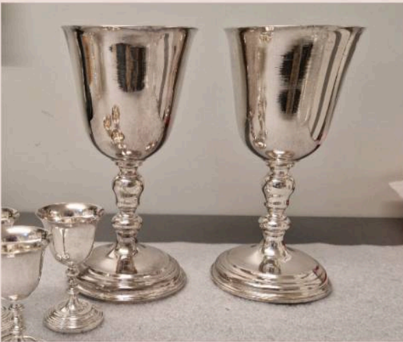
Coupes de Sainte-Cène, Philippus Prié Église wallonne de Middelbourg