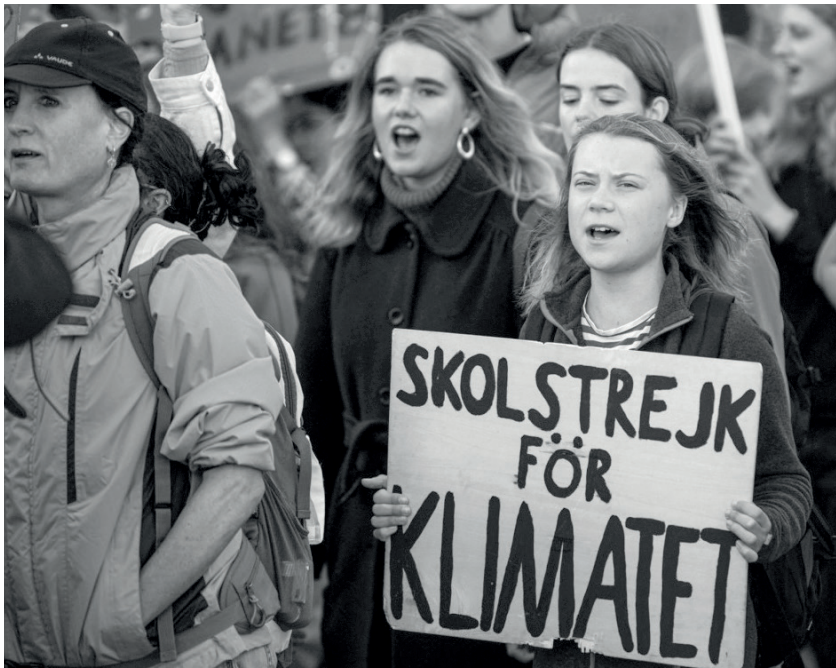
La militante suédoise Greta Thunber lors d'une manifestation du mouvement fridays for future à Stockholm en Suède, le 9 septembre 2022

Jean 1 1 Au commencement était la Parole, et la Parole était avec Dieu, et la Parole était Dieu. 2 Elle était au commencement avec Dieu. 3 Toutes choses ont été faites par elle, et rien de ce qui a été fait n'a été fait sans elle. 4 En elle était la vie, et la vie était la lumière des hommes. 5 La lumière luit dans les ténèbres, et les ténèbres ne l'ont point reçue.