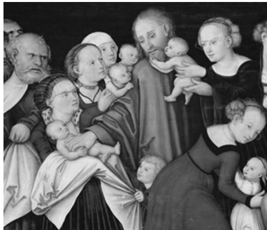
Jésus bénissant les enfants. Luukas Cranach le jeune [1515-1586]

Marc 10 13 Des gens lui amenaient des enfants pour qu'il les touche, mais les disciples les rabrouèrent. 14 En voyant cela, Jésus s'indigna et leur dit : "Laissez les enfants venir à moi, ne les empêchez pas, car le Royaume de Dieu est à ceux qui sont comme eux. 15 En vérité je vous le déclare : qui n'accueille pas le Royaume de Dieu comme un enfant n'y entrera pas." 16 Et il les embrassait et les bénissait en leur imposant les mains.