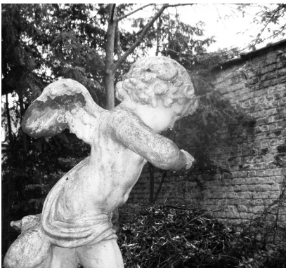
Ange gardien qui a bien fait son travail